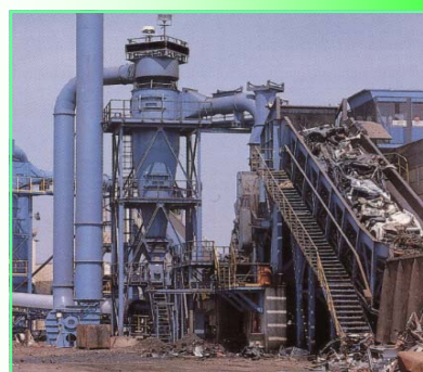
Ligne de broyage automobiles