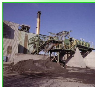
Ligne de traitement des machefers (résidus d'incinération)