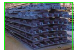
Coffrage poteau - Coffrage métallique à rayon variable