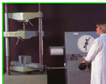
Machine à traction (0 à 40000 DaN)

Le groupe vient de réaliser une double opération de croissance externe dans la région de Valenciennes. HIOLLE Industries vient, en effet, d'acquérir 100 % du capital de la société THERMIVAL. Cette petite société, de 6 salariés pour un chiffre d'affaires de 4 millions de francs, est un laboratoire d'essais mécaniques destructifs et non destructifs. Elle développe également ses activités dans le domaine du traitement thermique. Cette entreprise, certifiée ISO 9002, sera amenée à croître au sein du groupe notamment en renforcement des contrôles « qualité ».